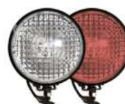
фары на СИМ